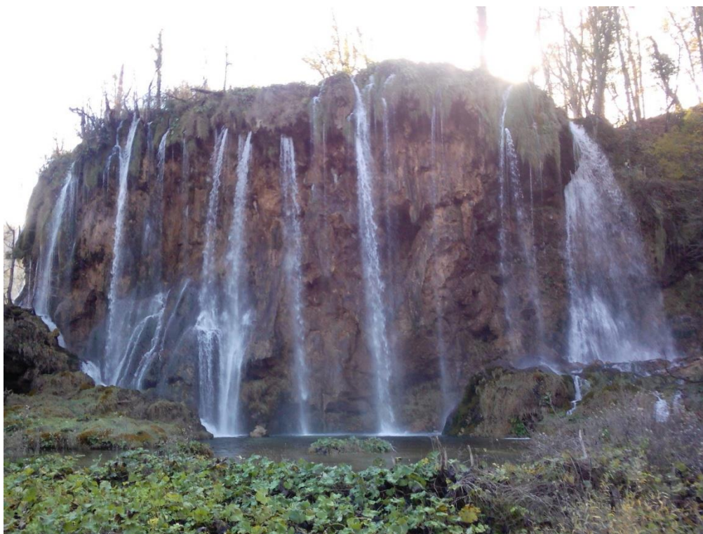
Park Narodowy Jezior Plitwickich